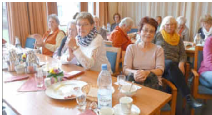
Frühstückstreffen am 27.10.18