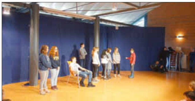
„Krieg im Gemüsebeet“