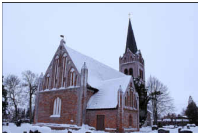
Winterimpressionen - Kirche Liepen

Dienstag, den 5. März um 14:30 Uhr im Pfarrhaus.