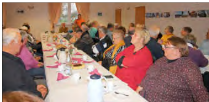
Fast 50 Interessenten sind zum Plattdeutschnachmittag an der Kaffeetafel ins Gemeindehaus Kagendorf gekommen.

Liebe Bürgerinnen und Bürger der Gemeinde Krien,