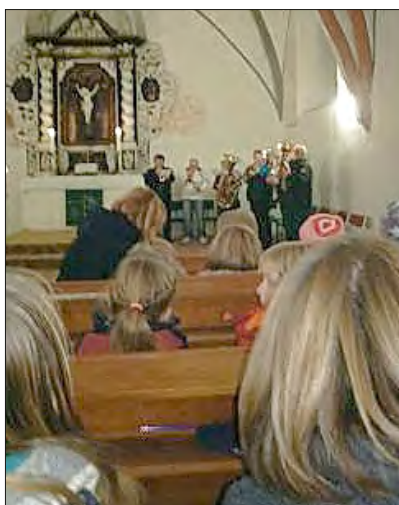
Bläser beim Martinsfest am 08.11.19 in der Kirche in Krien.