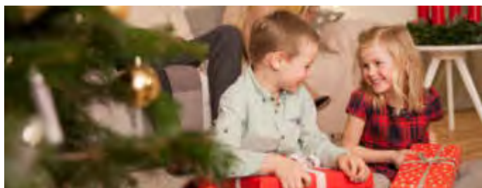
Die besondere Stimmung der Weihnacht einfangen: Mit einigen Tipps gelingen Fotos der Festtage besonders gut.

(djd). Wenn am Weihnachtsabend die ganze Familie zusammenkommt, um gemeinsam die schönste Zeit des Jahres zu zelebrieren, entstehen besondere Momente. Ob beim festlichen Weihnachtsessen, beim Geschenkeauspacken oder gemütlichen Beisammensein rund um den Tannenbaum: Heiligabend bietet zahllose Motive für Familienfotos. Damit die Schnapshotschüsse gelingen, sollte man etwa bei besinnlichem Kerzenschein aufs Blitzen verzichten. Das wichtigste Motiv auf Weihnachtsfotos sind natürlich die Menschen. Um von allen ein schönes Bild einzufangen, eignen sich vor allem kleinere Gruppenbilder. Mehr Tipps für gelungene Weihnachtserinnerungen und Inspirationen erhält man etwa unter www.cewe.de . Hobbyfotografen können online direkt ein Fotobuch mit ihren Lieblingsmotiven erstellen.